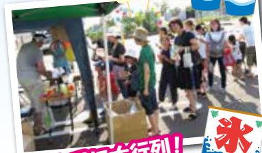
かき氷屋に大行列!